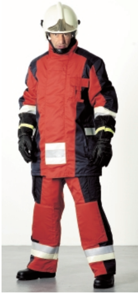
...strapazierfähig und pflegeleicht...