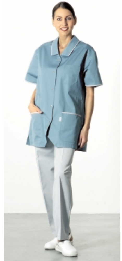
Körperschutz muss dem Einsatzzweck entsprechend ausgewählt werden...

► Was kann in vernünftiger Zeit mit vernünftigem Aufwand realisiert werden?