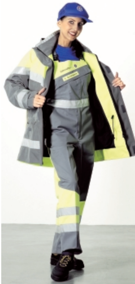
...und nicht zuletzt auch bequem zu tragen sein.

gen erfüllen, kommen in die engere Evaluation