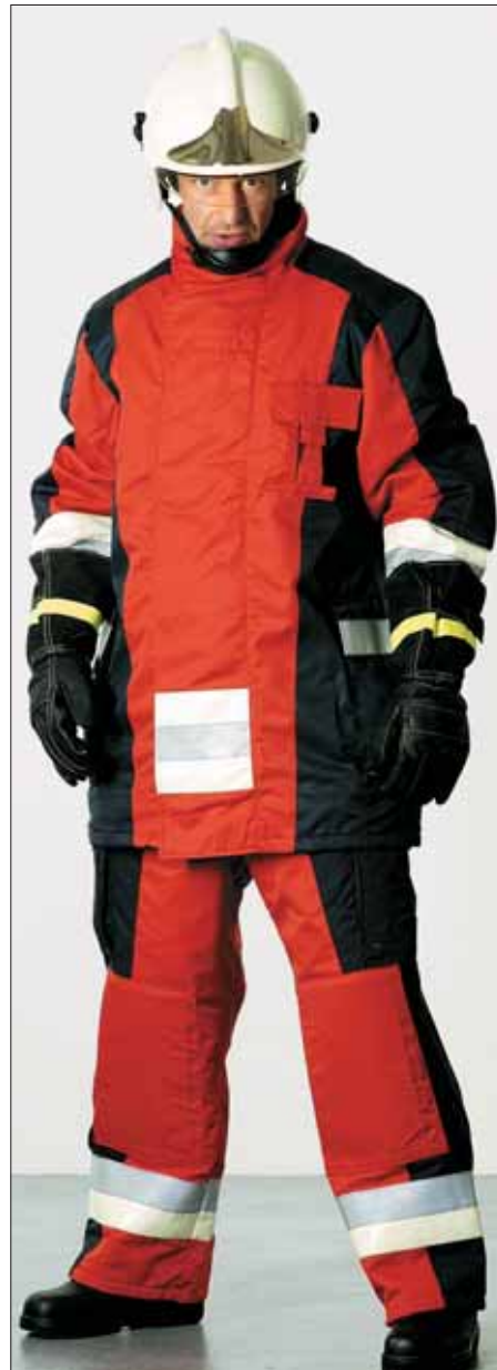
...strapazierfähig und pflegeleicht...