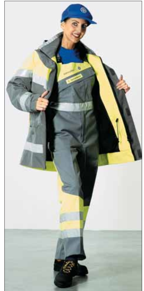
...und nicht zuletzt auch bequem zu tragen sein.

► Wenn Ihre Mitarbeiter selber waschen, braucht es eine spezielle Instruktion (z.B. für nicht deutschsprachige, männliche Singles).