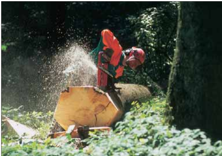
Auswahl und Einsatz von PSA mit den Mitarbeitern vor Ort besprechen schafft Verständnis und erhöht die Trageakzeptanz.

Mitarbeiter zum Wechseln der Kleider zu bringen (ausser für ganz besondere Jobs).