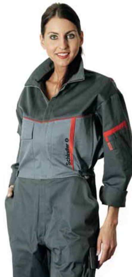
Körperschutz muss dem Einsatzzweck entsprechend ausgewählt werden...

► Sie können die Mitarbeiter mit entsprechender PSA für viele Risiken gut schützen. Der Feuerwehrmann, der nicht immer sehr genau weiss, was im Innern eines Gebäudes auf ihn zukommt,