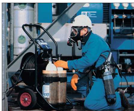
Abb. 2. Druckschlauchgerät für den Langzeiteinsatz.

Bei frei tragbaren Isoliergeräten wird die benötigte Atemluft vom Geräteträger selbst mitgeführt. Dieser Gerätetyp weist deshalb den Vorteil einer praktisch uneingeschränkten Beweglichkeit auf, dagegen wird durch den begrenzten Atemgasvorrat die Einsatzzeit begrenzt. Bei frei tragbaren Isoliergeräten unterscheidet man zwischen Behältergeräten mit Druckluft