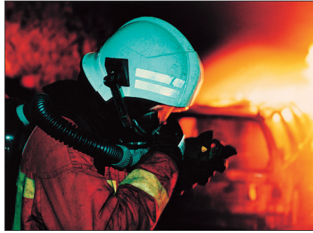
Abb. 4. Kreislaufgerät mit elektronischer Signal- und Warneinheit.

Bei Regenerations- oder Kreislaufgeräten wird die ausgeatmete Luft nicht wie beim Pressluftatmer in die Umgebung geleitet, sondern im Gerät regeneriert. Hierfür werden das Kohlendioxid der Ausatemluft und ein Teil des Wasserdampfes in einer Regenerationspatrone gebunden und der verbrauchte Sauerstoff aus dem mitgeführten Vorrat ersetzt. Letzterer kann in gasförmiger (Sauerstoffschutzgeräte), flüssiger (Flüssigsauerstoffgeräte) oder aber chemisch gebundener Form (Chemikaliensauerstoffgeräte) mitgeführt werden. Kreislaufatemschutzgeräte finden überall dort Anwendung, wo Langzeiteinsätze gefragt sind. Der Bergbau gehört hierbei zu den traditionellen Einsatzgebieten. Aber auch für den Einsatz in immer längeren Strassen-