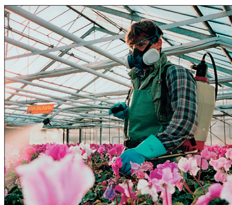
Abb. 1. Leichter Atemschutz setzt genügend Sauerstoff und bekannte Gefahrstoffe voraus.

Filtergeräte werden integral oft auch als leichter Atemschutz bezeichnet. Sie dürfen verständlicherweise nur dann eingesetzt werden, wenn genügend Sauerstoff in der Atemluft vorhanden ist und die zur Verfügung stehenden Filter vor bekannten (!) Dämpfen und Gasen schützen (Abb. 1).