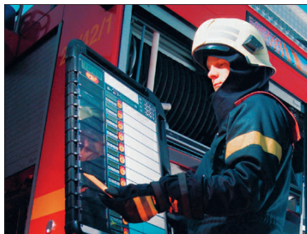
Abb. 5. Elektronische Überwachungstafel.

Bei Verwendung einer optionalen Funkeinheit können zusätzlich alle Daten vom Einsatzleiter an einer elektronischen Überwachungstafel ausserhalb des gefährdeten Einsatzgebietes abgelesen werden – ein nicht zu unterschätzender Sicherheitsgewinn! Telemetrische Überwachungs- und Kommunikationssysteme übertragen auch die Alarmsignale vom Geräteträger zur Überwachungstafel oder umgekehrt einen Evakuierungsbefehl des Einsatzleiters an den Geräteträger. Darüber hinaus wird ein Einsatzleiter von dem auf modernster Funktechnologie basierenden System ständig über den aktuellen Zu-