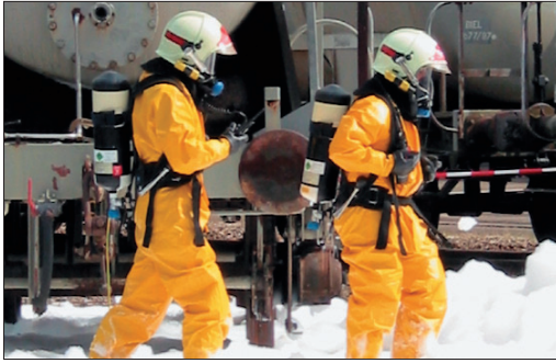
Abb. 3. Leichter Chemieschutzanzug mit Pressluftatmer.

(Pressluftatmer) (Abb. 3) und Regenerationsgeräten (Kreislaufgeräte).